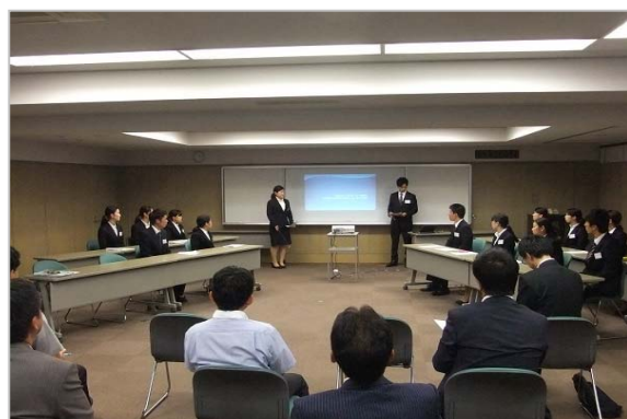
「インターンシップの受け入れ（大学）」