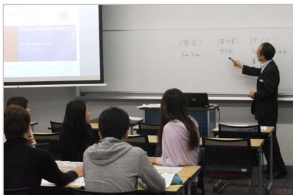
「金沢星稜大学寄付講座」