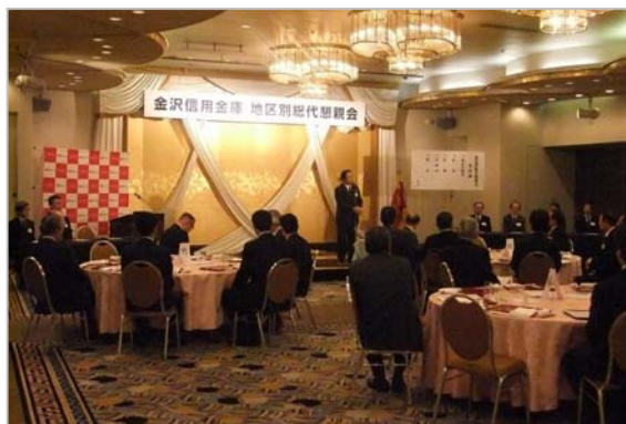
「地区別総代懇親会」