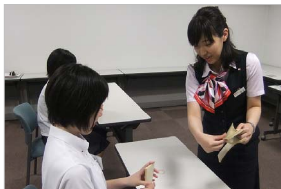
「インターンシップの受け入れ（高校）」