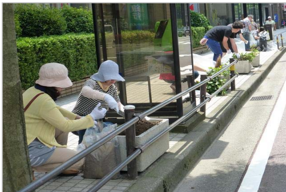
「花の植え替えボランティア」