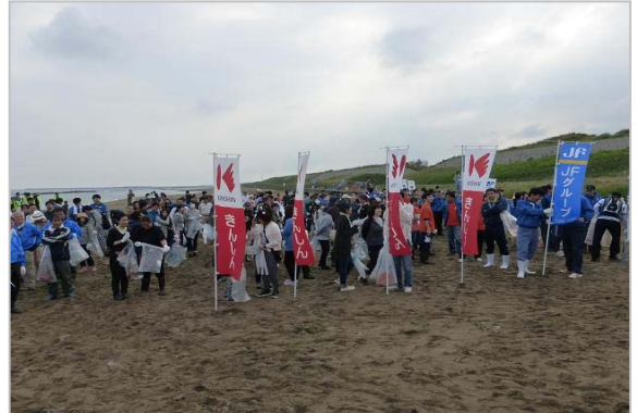
「クリーン・ビーチいしかわ」