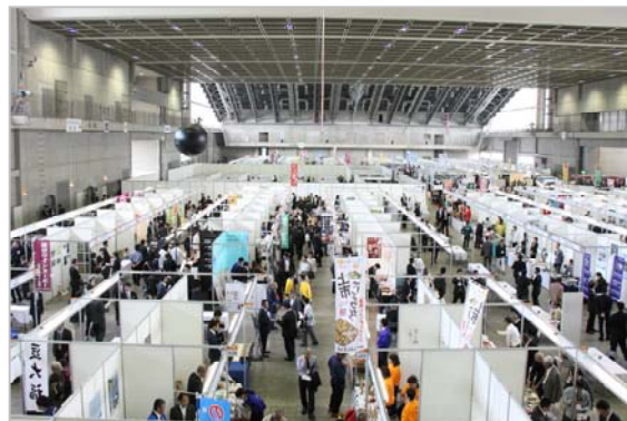
「北陸ビジネス街道 2015」