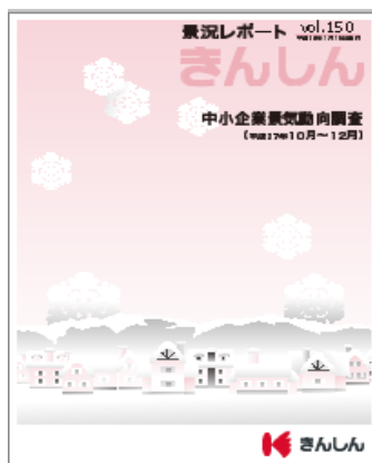
「景況レポートきんしん」