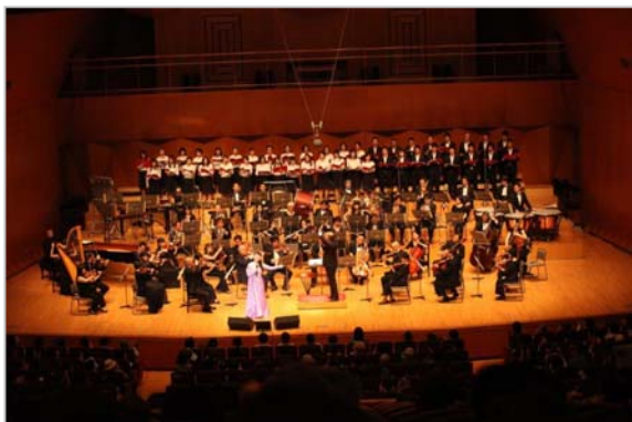
「きんしん年金友の会 会員の集い」