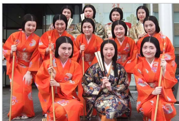
「百万石行列（職員の参加）」