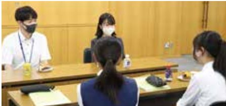
8月3日(木)職員との座談会の様子

倉敷商業高等学校の生徒2名を対象に、インターンシップを実施しました。信用金庫の役割や現在の金融経済情勢について学んだ他、営業店の視察や業務体験、当金庫の新入職員との座談会を通じて、学生と社会人の違いや当金庫の雰囲気を感じていただきました。