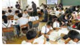
金融教室18日(月)の様子

吉備信用金庫はキッズマネー教室や、インターンシップの受け入れ等、金融教育の機会を提供しております。