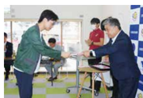
8月3日(木)贈呈式の様子

第11回きびしん地域振興支援制度「吉備の新風」の受賞者に助成金を贈呈しました。本制度は、起業・新規事業の支援として平成24年から取り組んでおり、地域経済活性化に直接的、間接的に寄与する事業に対して助成金を贈ることで、新規事業者を応援しています。今回の募集では22先の応募があり、そのうち15先が受賞されました。