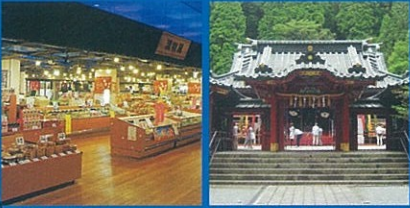
▲沼津ぐるめ 街道の駅