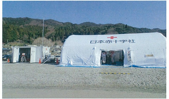
緊急対応ユニットdERU 展開後は救護所として機能する