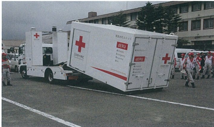
緊急対応ユニットdERUの設営