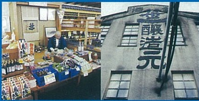
▲笹一酒造・酒遊館

この度の東日本大震災により、犠牲になられた皆様に、心よりご冥福をお祈り申し上げますとともに、被害にあわれた皆様、そのご家族の皆様に、心よりお見舞い申し上げます。