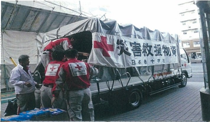
東京都支部から石巻赤十字病院への物資輸送