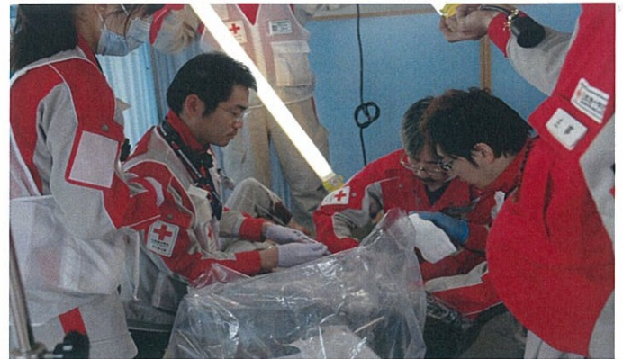
蛍光灯を手に懸命な救護活動が行われた