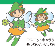
マスコットキャラクター: もっちゃん・りっちゃん