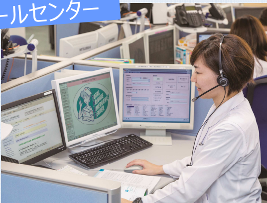
ご相談に対応するヘルスカウンセラー

医師・保健師・看護師・心理カウンセラー・ケアマネージャーなどの経験豊富なスタッフが相談にお応えいたします。まずはお気軽にお電話ください。