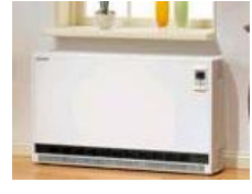
蓄熱式電気暖房器