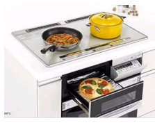
IHクッキングヒーター