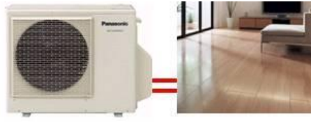
ヒートポンプ式温水床暖房