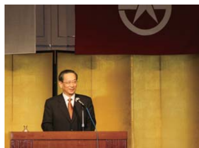
北川正恭氏を招いての総代講演会