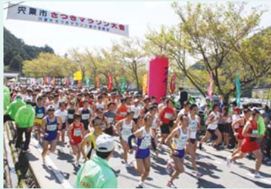
宍粟山崎さつきマラソン大会

にしん 地域振興財団は、地域貢献の一環として にしん が基金の全額を拠出して設立した団体です。現在の基本財産は1億85百万円となっています。西播磨地区の振興発展を図るために、平成19年度は次の通り事業の助成を行いました。