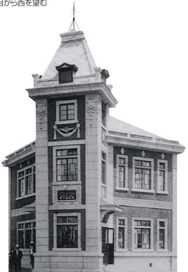
昭和2年~昭和36年までの店舗