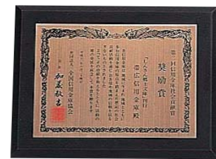
第2回信用金庫社会貢献賞・奨励賞受賞