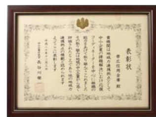
地域力連携拠点事業「中小企業庁長官賞」受賞