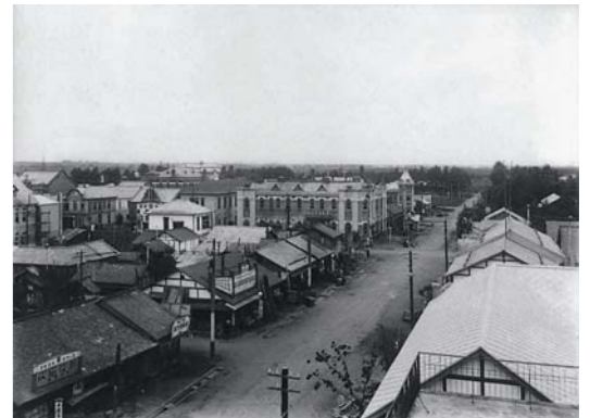
大正末期の店舗周辺7丁目から西を望む