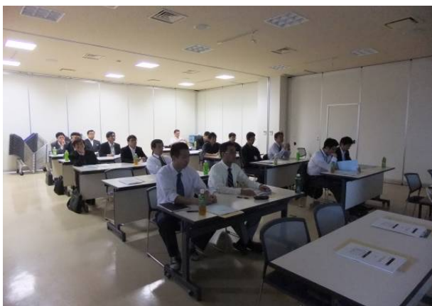
共同研究成果報告会大樹会場