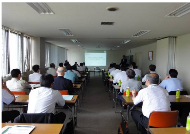
共同研究成果報告会足寄会場