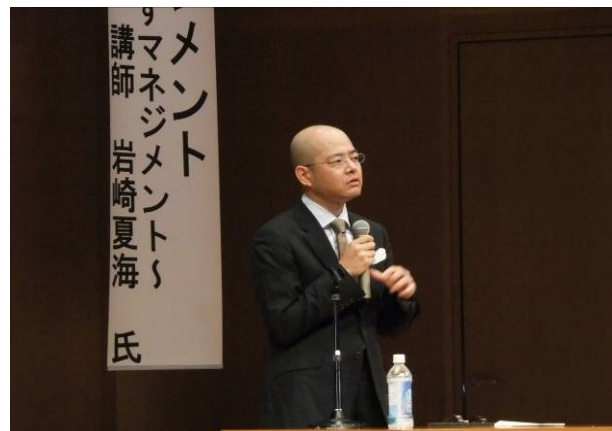
おびしん地域振興セミナー