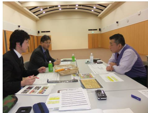
ビジネスマッチング商談会