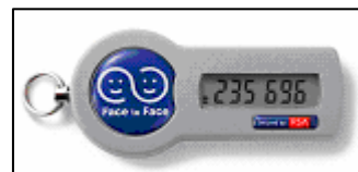
パスワード生成機（トークン）見本