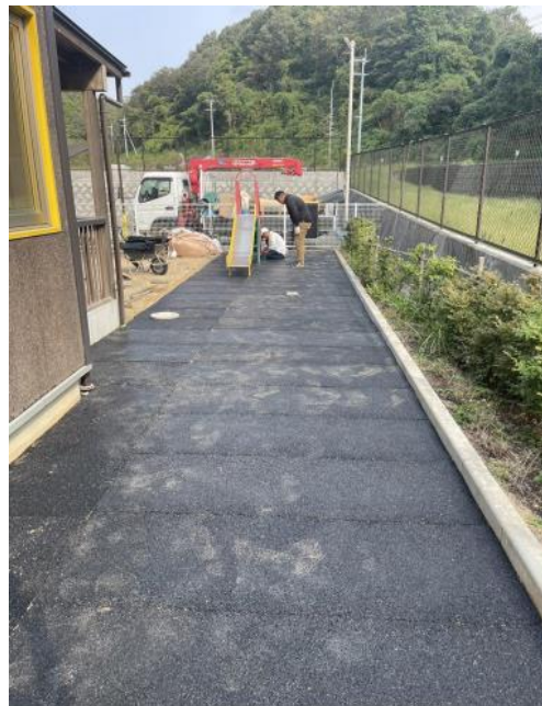
赤坂研究所内（のびのび象さん保育園） 下地にEPDMゴム板を数均し弾性感を確保

2019年より天然コルクを活用した舗装材「ドリームコーク」の販売を開始。コルクを薄層施工する環境配慮型舗装です。下地にはコンクリートだけでなく、当社が製造過程で排出しているゴム原料を有効活用し、より弾性感のある安心安全を確保した歩行者空間を提案しております。