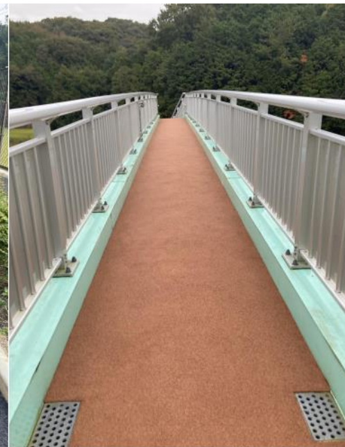
赤坂研究所内（社員専用歩道橋） 社員が道路を横断する事が無き様、安心安全を確保