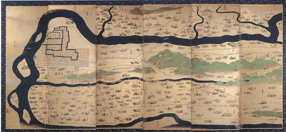
久留米藩領図屏風・左隻 (久留米市教育委員会蔵)

会場時間 10時~18時 休館日 毎週水曜、第4木曜 会場 六ツ門図書館展示コーナー (くるめりあ六ツ門5階) 〒830-0031 久留米市六ツ門町3-11 電話 0942-27-9281 FAX 0942-27-7281 主催 久留米市・久留米市教育委員会