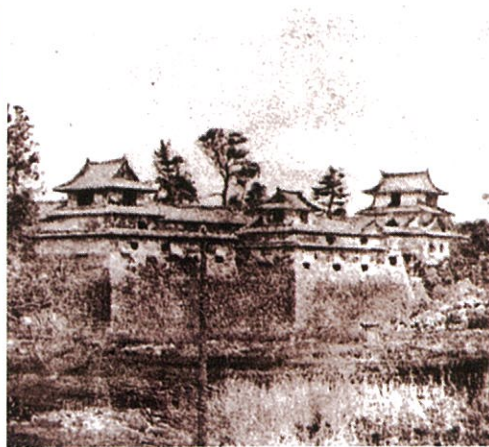
明治時代の久留米城