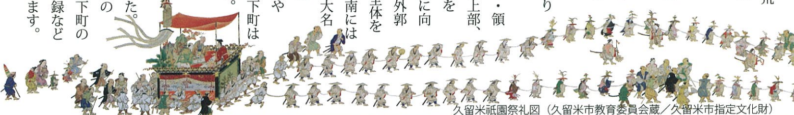
久留米祇園祭礼図 (久留米市教育委員会蔵/久留米市指定文化財)