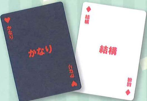
▲「ノノトランプ」(発行:株式会社サグイネル)