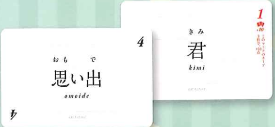
▲「狩歌」基本セット(発行:株式会社サグイネル)