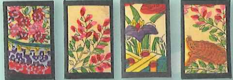
▲「手摺り小花」(発行:松井天狗堂)