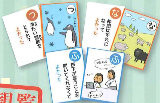
▲「人生よかったカルタ」 上左:こども版・上右:通常版 下:おじさん版 (発行:株式会社HIROWA)