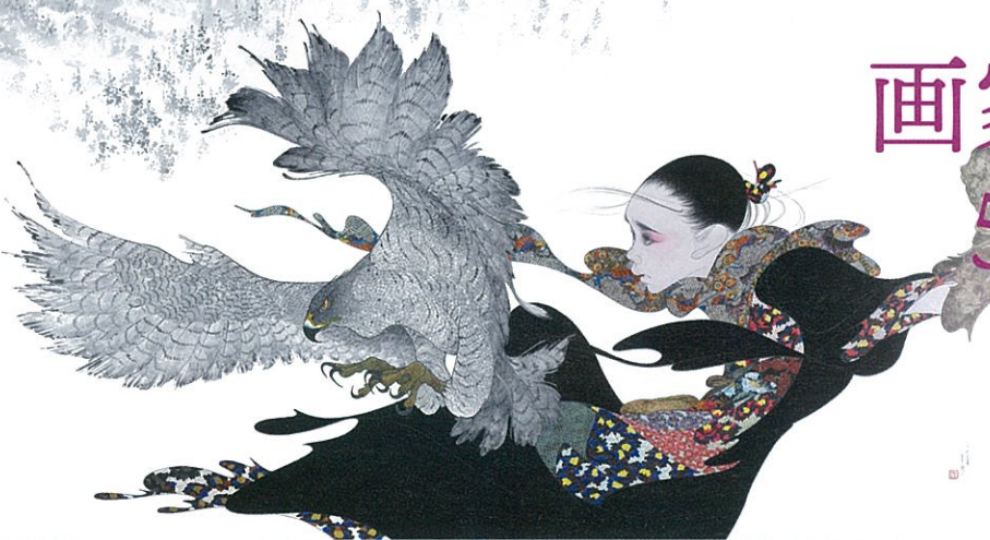
「鷹匠」(部分) 2018 ©中島潔

唐津市厳木町出身の風の画家・中島潔。画業50周年の節目に、新作のテーマとして選んだのは「女性画」です。女性の輝く感性と創造性を高める機会を応援したい、柔軟な発想で新しい文化を生み出す女性たちが社会でより活躍してほしい、作品にはそんなメッセージが込められています。自由・自立の精神にあふれた女性たちの姿を、変化に富む美しい日本の生活や四季の風景を背景に、人生の“一瞬間”を切り取り描きました。