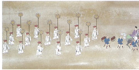
こうら せんたまたれくうしんこう え まき 《高良山玉垂宮神幸絵巻》 江戸時代後期 久留米市教育委員会蔵