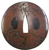
かつらえいじゆ じゆにはなれこますつば 桂永寿作《十二放駒図鐘》 江戸時代後期 久留米市教育委員会蔵 手のひらに収まる大きさの鐘に、野を駆ける馬たちが線彫りされている。