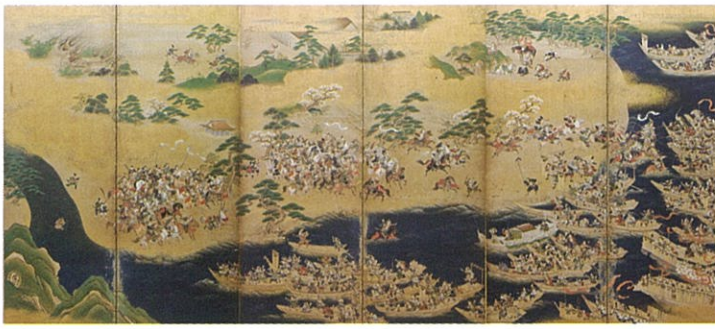
三谷永伯筆《源平合戦図屏風(一ノ谷・屋島)》 江戸時代中期 有馬家蔵 久留米藩お抱え絵師の技術の高さを示す、平家物語にもとづいた合戦図屏風の傑作。