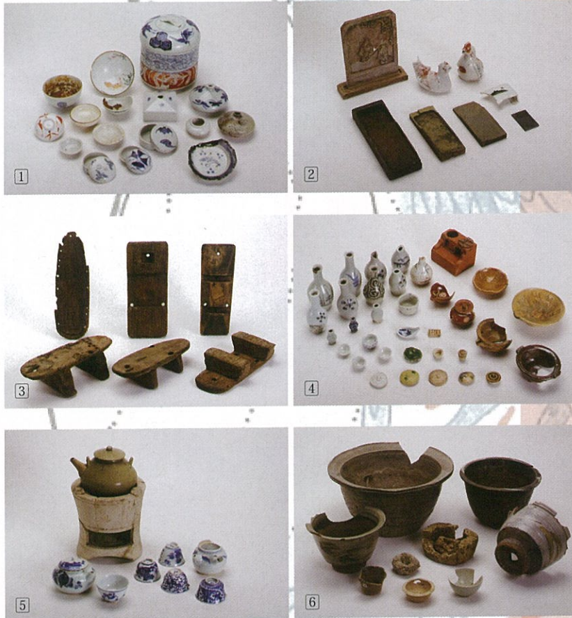
① 化粧道具 ② 文房具 ③ 下駄 ④ ミニチュアままごと道具 ⑤ 煎茶道具 ⑥ 植木鉢各種 [以上、久留米市教育委員会所蔵]