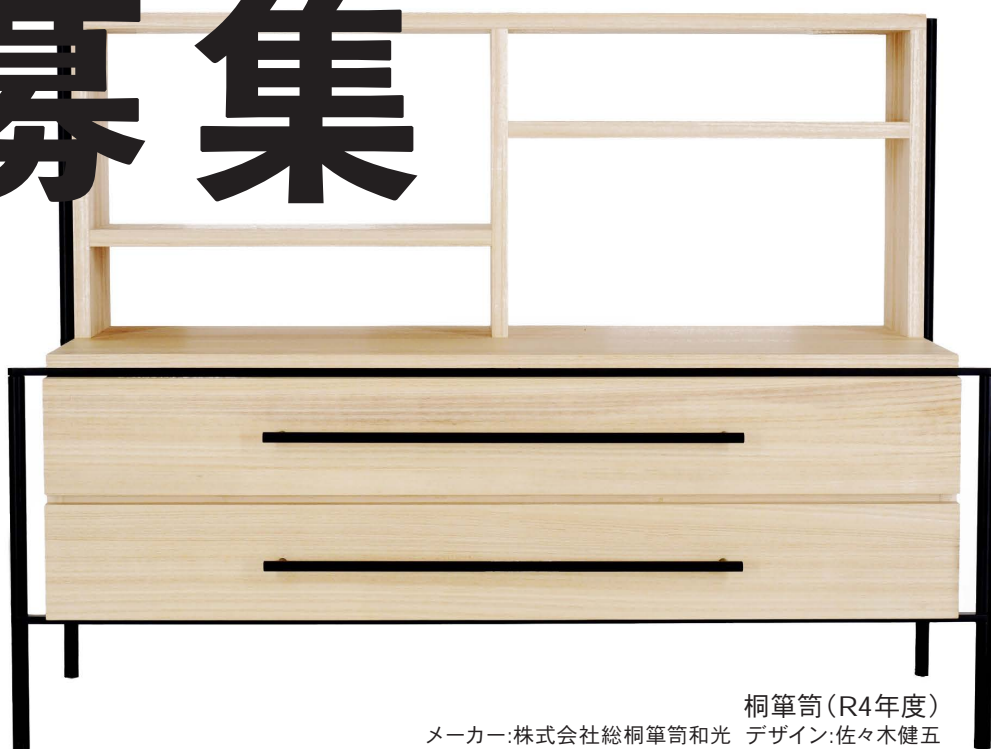
桐筆筒 (R4年度) メーカー:株式会社総桐筆筒和光 デザイン:佐々木健五