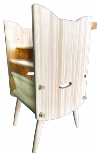
猫イス (R4年度) メーカー:株式会社馬場木工 デザイン:松本意匠