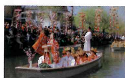
おひな様水上パレード