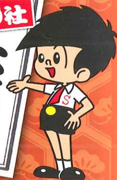
信用金庫のイメージキャラクター「信ちゃん」