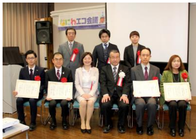
「CO 2 削減コンペ」受賞者