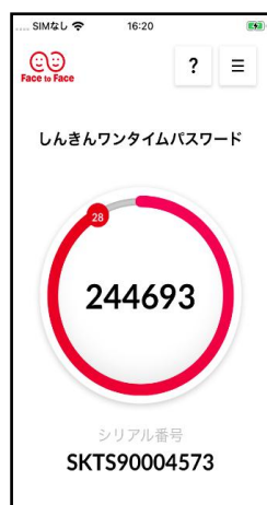
（ライトモードの例）