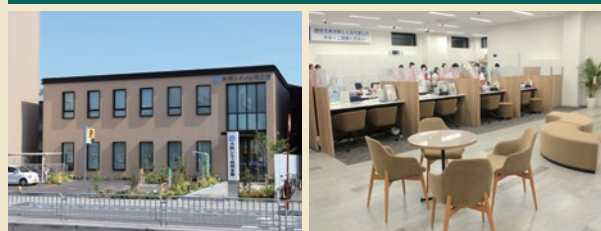
街並みに調和する店構え コミュニケーションを重視したロビー

当金庫の理事長が次の要職に就いています。信用金庫業界のみならず、経済団体等への積極的な参画によって、地域金融機関として地域経済の振興等にも貢献しています。