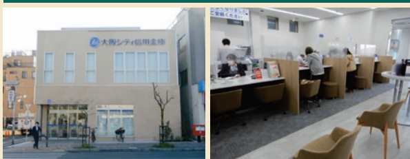
ページュを基調とする落ち着いた外観 ゆったりとした待合スペースのあるロビー