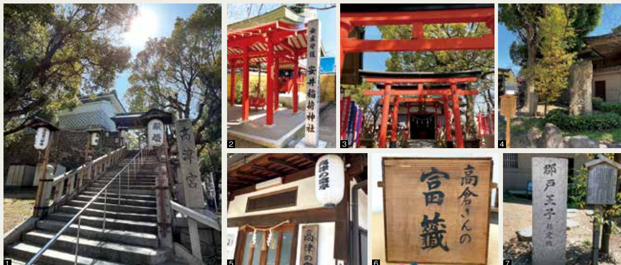
1 高津宮の北側の入口 2 道頓堀を開発した安井九兵衛にまつわる安井稲荷神社 3 高倉稲荷神社は芸事の神様 4 第5代桂文枝の碑 5 落語の寄席が開かれる高津の富亭 6 高倉社初午大祭で引く「富くじ」 7 熊野街道の「郡戸(こうと)王子」の碑も

大阪府中央区の高津宮は、難波に遷都したと伝わる「高津宮」を開いた仁徳天皇を主神とする神社です。境内には芸能に関わる稲荷や碑が建てられ、今も昔も人々が集う場としてにぎわっています。