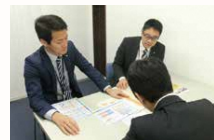
外部専門家派遣の支援

さがみ信用金庫では、“地域の未来を共創する信用金庫”を基本方針として、地域のお客様とともに発展することを考え、積極的な融資や社会貢献活動を通じて地域の活性化に取り組んでおります。