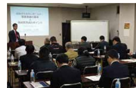
各種経営セミナー