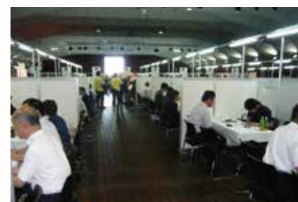
ビジネスマッチングwithかながわ8信金

お客様の課題解決を図るため、ビジネスマッチングや各種経営セミナーなどの イベントを開催し、地域活性化のお手伝いをしています。