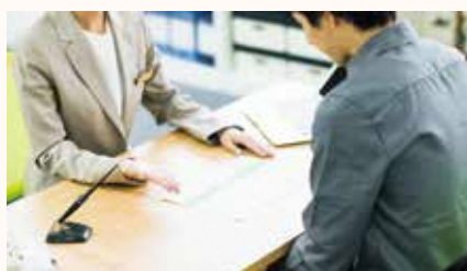
お気軽にご相談・ご活用ください。 ※ご相談いただいた内容は秘密厳守します。

STEP4 フォローアップ お客様にご提案させて頂いた案件のフォローアップを行います。