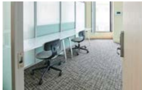
インキュベーションルーム(各6室 / 5.73～11.74m 2 ) 各部屋パーティションで仕切られています。