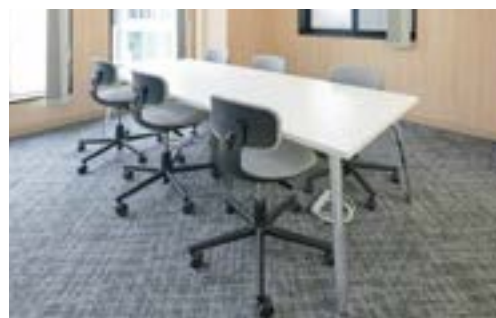
フリーフロア 会議室、フリーデスク、テーブル等を使用できます。 商談・打ち合わせ等でご利用ください。