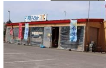
片桐マーケット (夕張郡長沼町西6)