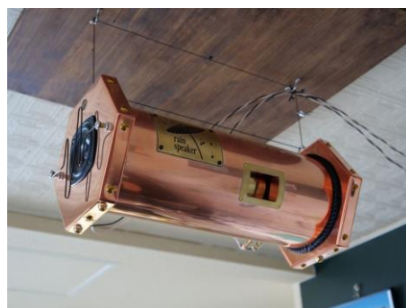
レインスピーカー

空知信金の担当職員が、「 北海道知財総合支援窓口 」に関する情報を提供。知財総合支援窓口の担当者や弁理士のアドバイスを受け、「 意匠権 」および「 商標権 」を取得し、製品の独自性を保護しました。