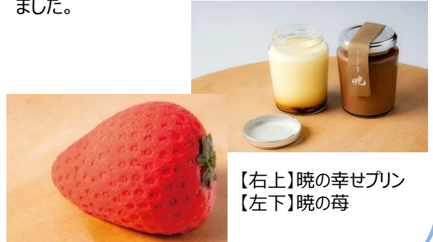
【右上】暁の幸せプリン 【左下】暁の苺

人手不足については本部と連携し、製菓コースのある 北海道三笠高校とのマッチング を実施し、古田オーナーが講師となり製菓実習を行いました。