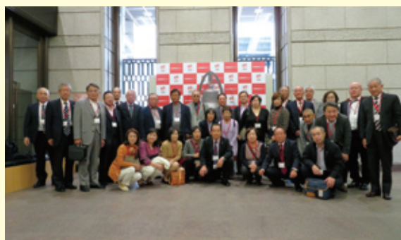
たてしんビジネスクラブ

経営改善支援対象企業14社を抽出し、財務改善のアドバイス、経費削減等の指導を行い、地域金融機関として親身になって対応し、対象企業の課題解決に向けた経営改善計画の策定等の支援を行い、取引先のランクアップを目指しました。令和元年度においては、2件のランクアップ先を出す事が出来ました。引き続き対象企業の課題解決に向け、支援強化してまいります。