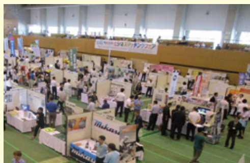
令和元年度ビジネスマッチングフェア