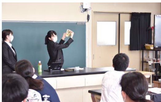
中学校での「仕事に関する講話」での様子