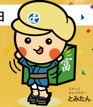
イメージキャラクター とみたん