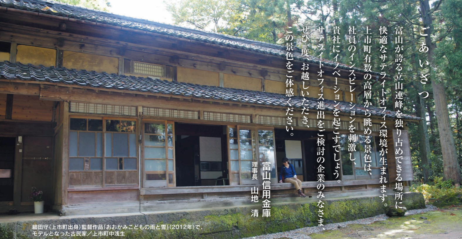
細田守(上市町出身)監督作品「おおかみこどもの雨と雪」(2012年)で、モデルとなった古民家/上市町中浅生