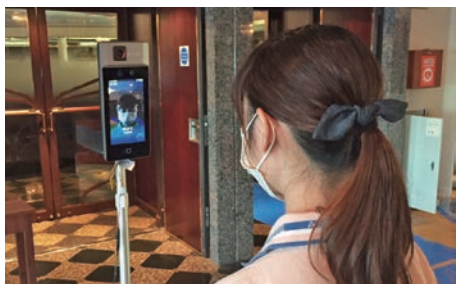
乗船時・船内施設での検温