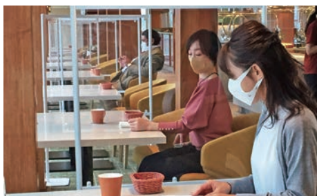
座席間のパーテーションの設置