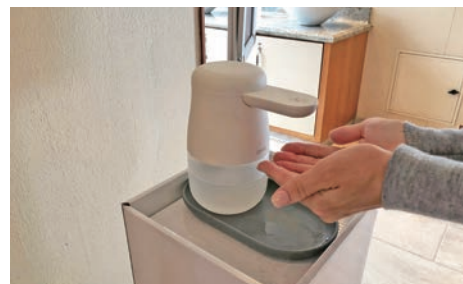
アルコール消毒液の設置