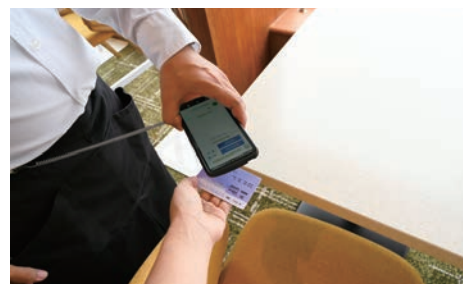
座席確認の為、乗船証の読取