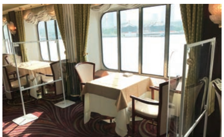
ソーシャルディスタンスの確保