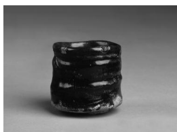
「織部黒茶碗」元屋敷窯 17世紀 重要文化財