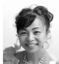
水野妃佐子(メソソプラノ)