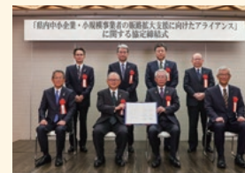
販路拡大支援に向けたアライアンス