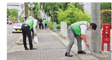
信用金庫の日清掃活動