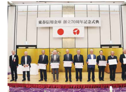
永年総代感謝状贈呈