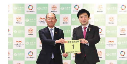
小牧シティマラソン大会にゼッケンの寄贈

今年も令和5年1月22日(日)に小牧シティマラソンが開催されました。当金庫は、この大会に協賛し、選手が着けるゼッケンを平成16年から寄贈しております。当日は、当金庫の職員31名も小牧市民の皆様方と一緒にマラソンに参加させていただきました。