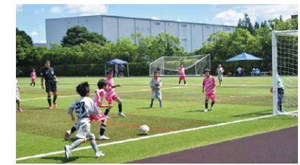
春日井市ジュニアサッカー選手権 新人大会

今年も令和5年1月22日(日)に小牧シティマラソンが開催されました。当金庫は、この大会に協賛し、選手が着けるゼッケンを平成16年から寄贈しております。当日は、当金庫の職員31名も小牧市民の皆様方と一緒にマラソンに参加させていただきました。