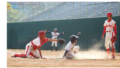
第6回 東春信用金庫杯争奪少年野球大会

当金庫は、地域のスポーツ団体と連携し、各種スポーツ大会を開催しております。2022年度は少年野球大会、少年サッカー大会、バレーボール大会およびバドミントン大会を開催いたしました。