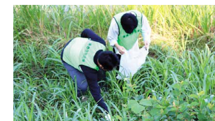
大山川クリーンアップ行事 2022年10月1日