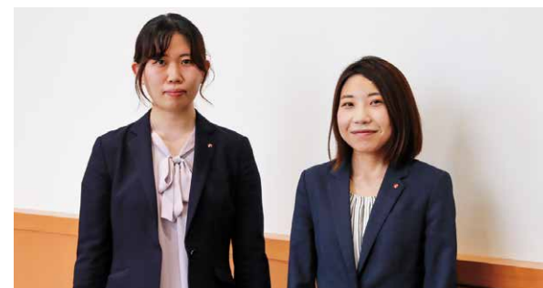
各店舗でお客さまの資産形成をサポートする他、本部にはより専門的な職員「りんどうレディ」を配置しております。