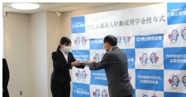
(奨学金授与式の様子)