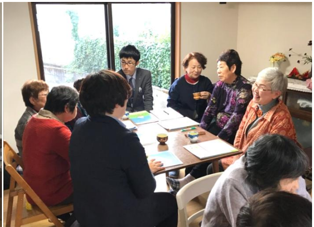
(参加者との座談会の様子)