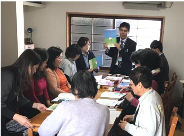
(エンディングノートの活用に関する講演の様子)