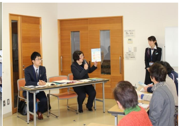
(当金庫講師による講義の様子)