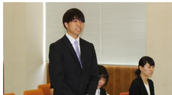
(奨学生よりお一人ずつコメントを頂きました)