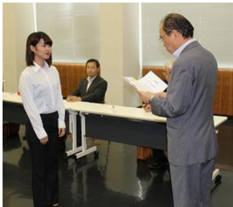
(奨学金授与式の様子)