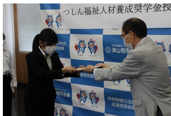
(奨学金授与式の様子)