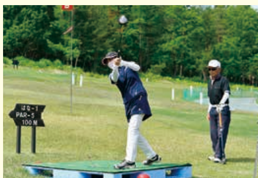
パークゴルフ大会の開催