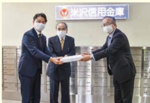
福祉施設へタオル贈呈