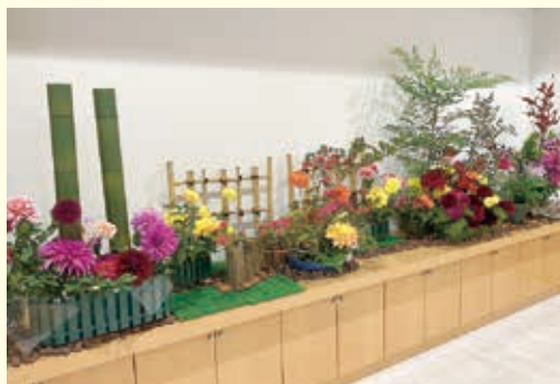
川西ダリア展の開催 (しんきんギャラリー)