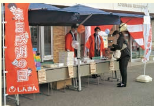
ご来店感謝デーの開催