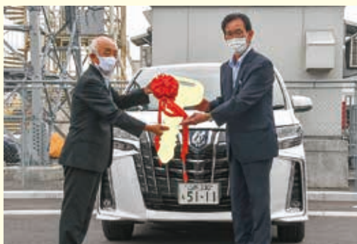
米沢市長用公用車など寄贈