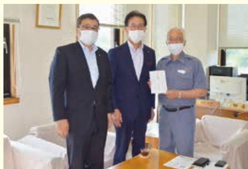
川西町、飯豊町へ災害見舞金の贈呈