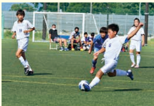
米沢信用金庫杯少年サッカー大会