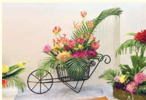
川西ダリヤ展の開催