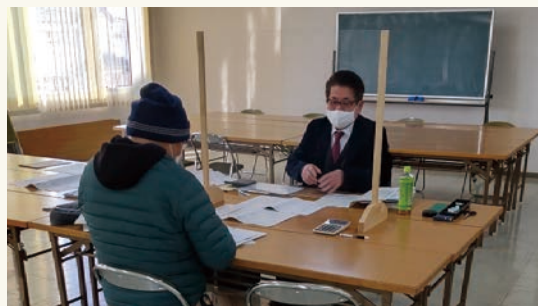
所得税還付申告相談会を実施