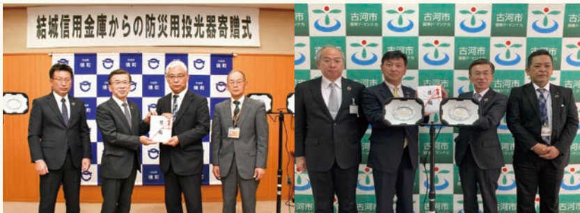
境町(11/9)、古河市(11/10)に防災用投光器を寄贈