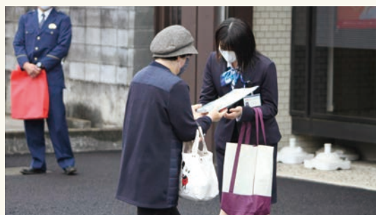
ニセ電話詐欺防止キャンペーン