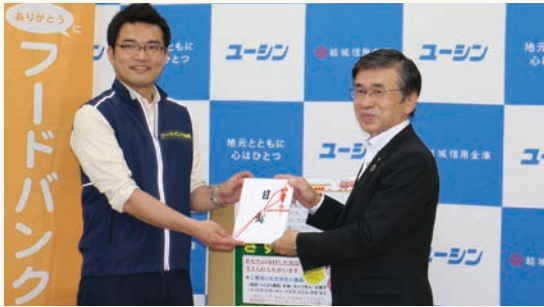
NPO法人フードバンク茨城へ食料品を寄贈