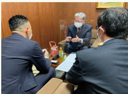
よろず支援拠点と連携した経営課題の個別相談会を実施