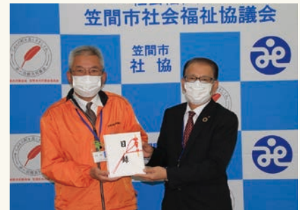
笠間市社会福祉協議会へ善意金を寄附