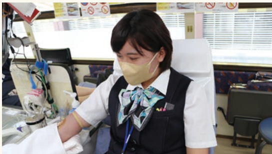
本店敷地内での献血の様子