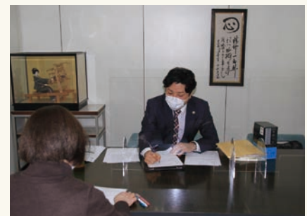
弁護士の個別相談方式による無料相談会