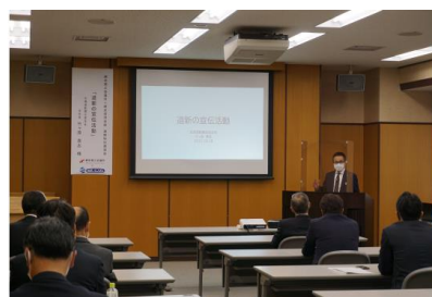
〔上段はサテライト・ゼミの写真、下段は情報交換会および講演会の写真〕