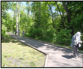
①こまば木のひろば

今回からは地域の隠れた名所「かくれスポット」の紹介を行います。第1回は網走市の隠れた名所です。