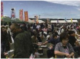
▲さんご草祭りの様子