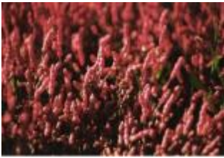
▲能取湖のサンゴ草

能取湖には大昔からサンゴ草が自生していました。サンゴ草は正式にはアツケシソウといいますが、秋になるとサンゴのような赤色になることからそのように呼ばれています。最盛期には3.8haもの面積に群生していましたが、2010年ごろから生育不良となり、一時は壊滅的な被害を受けました。サンゴ草群落地再生のため、卯原内観光協会が中心となり、サンゴ草の採取や土壌の改善を続けました。その結果、少しずつではありますがサンゴ草が復活し、現在も卯原内地区の観光資源として地域住民が守っています。 9月14日・15日に「第56回能取湖さんご草祭り」が開催され、真っ赤に染まったサンゴ草を眺めながらツブやホタテを焼いて食べられるほか、各種イベントを実施します。秋の行楽シーズンに立ち寄ってみてはいかがでしょうか。