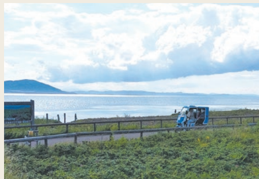
ワッカ原生花園の遊歩道を走る電動トライク ラヴィータ

た、流水の時期になるとオオワシやオジロワシなどの猛禽類やアザラシなどの海獣類を見られることもあります。