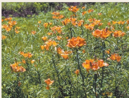
海岸草原は、さまざまな植物が夏の間咲き誇るのが見られます。写真はエゾスカシユリ

多くの鳥が立ち寄ります。また、バードウォッチングに訪れる人も多く、カモ類をはじめとした水辺の鳥や草原性の鳥を観察でき、オオハクチョウなどの渡り鳥の中継地ともなっているため、