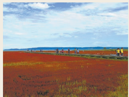
湖を赤く染める能取湖のサンゴ草群落地

カヤックを操りながら自然や野鳥観察を楽しめるツアーです。専属ガイドが案内し、網走国定公園内の自然や野鳥観察を楽しめ、網走刑務所の塀を横目にゴールします。見どころいっぱいツアーで、4月中旬から12月まで実施しています。