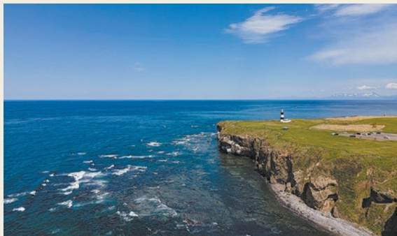
海蝕崖の風景が見どころの能取岬

サロマ湖は国内で3番目の大きさの湖で、周囲は92kmに及びます。夏はキャンプで賑わい、サロマ湖に沈む夕日の絶景に引き付けられる人は少なくありません。ワッカ原生花園では6月になるとエゾスカシユリやハマナスなどが見られます。小清水原生花園でも夏にはさまざまな花が咲き、訪れる人を楽しませてくれます。また、遊歩道や木道からは斜里岳を望むことができます。網走国定公園では、訪れるたびに湖沼群やそこに息づく動植物の新たな魅力を発見できます。