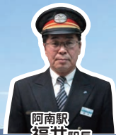
阿南駅 福井 駅長