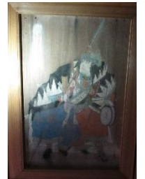
椿泊 佐田神社の絵馬

四国に存在する地域資源・文化資源を掘り起こし、地域と協働して付加価値付けされた観光素材・文化素材に磨き上げ、観光による地域活性化を目指す取り組みです。