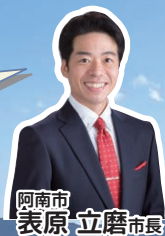
阿南市 表原 立磨 市長

四国最東端に位置する阿南市は、海・山・川の自然に恵まれ、若杉山遺跡や阿波水軍などの由緒ある史跡と四国遍路のお接待文化が息づく一方で、LEDの世界的シェアを誇る地場企業があるなど、豊かな自然と文化、産業が鮮やかに調和したまちです。