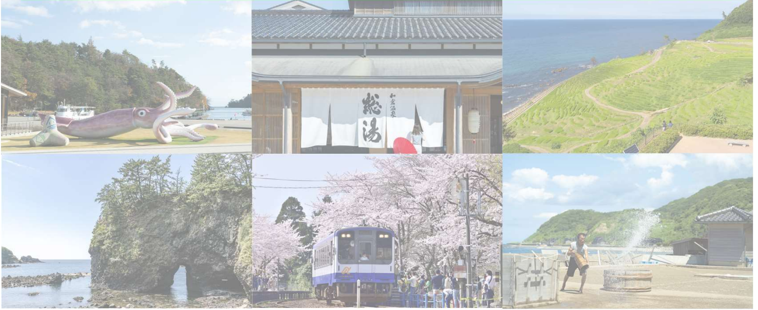
上部左:イカの駅 つくモール(能登町) 上部中央:和倉温泉総湯(七尾市) 上部右:白米千枚田(輪島市) 下部左:巖門(志賀町) 下部中央:能登さくら駅(穴水町) 下部右:揚げ浜塩田(珠洲市)